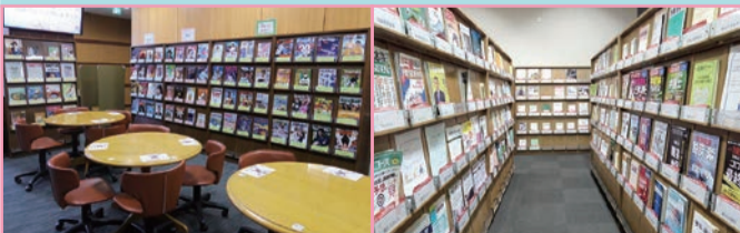
1F グループ学習スペース