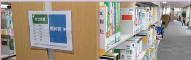
1F 第7閲覧室 学習用図書

シラバスに掲載されている教科書や参考文献があります。教科書は貸出できませんが、参考文献は禁帯出の本以外は貸出できます。