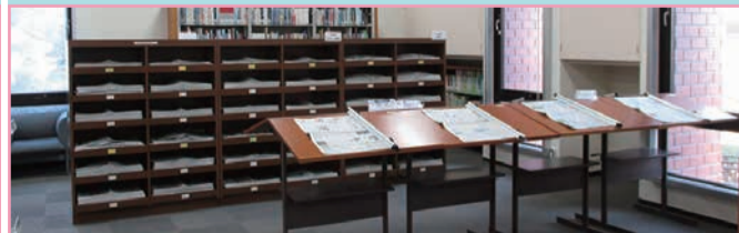
1F 第1閲覧室 新聞コーナー

学習用図書コーナーの奥にあります。全国紙、地方紙、外国新聞などを揃えています。パソコン上で記事検索できるデータベースも利用できます。