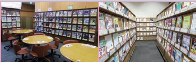
1F グループ学習スペース