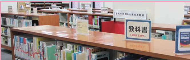
1F 第1閲覧室 学習用図書コーナー

シラバスに掲載されている教科書や参考文献があります。教科書は貸出できませんが、参考文献は禁帯出の本以外は貸出できます。