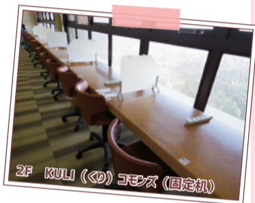
2F KULI (くり) コモンズ (固定机)