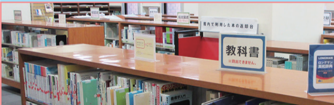
1F 第1閲覧室 学習用図書コーナー

シラバスに掲載されている教科書や参考文献があります。教科書は貸出できませんが、参考文献は禁帯出の本以外は貸出できます。