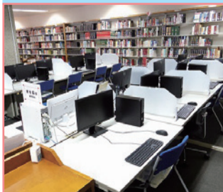
1F 第1閲覧室 (10台)