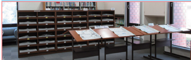
1F 第1閲覧室 新聞コーナー