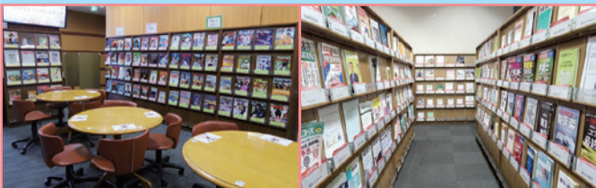
1F グループ学習スペース