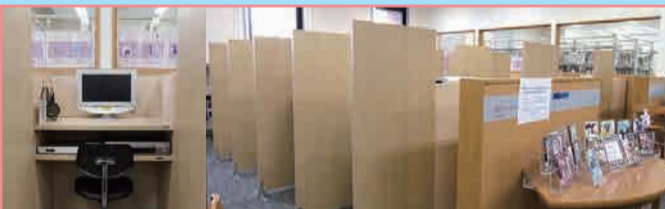
1F AV コーナー

カウンターに学生証を提示して利用できます。 映画やドラマの他にも、就活に役立つものや 専門的な資料も揃えています。