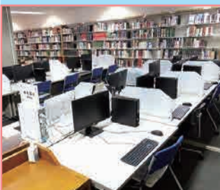
1F 第1閲覧室 (10台) 2F KULI (クリ) コモンズ (16台) 3F 第5閲覧室 (14台)