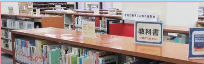
1F 第1閲覧室 学習用図書コーナー

シラバスに掲載されている教科書や参考文献 があります。教科書は貸出できませんが、参 考文献は禁帯出の本以外は貸出できます。