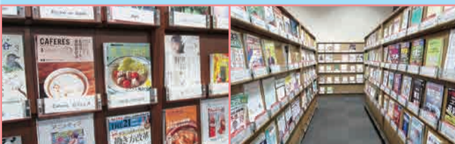
1F グループ学習スペース 2F 学術雑誌閲覧室

ファッション、映画、料理などの一般雑誌は 1F グループ学習スペース。専門的な内容の雑 誌は 2F 学術雑誌閲覧室にあります。