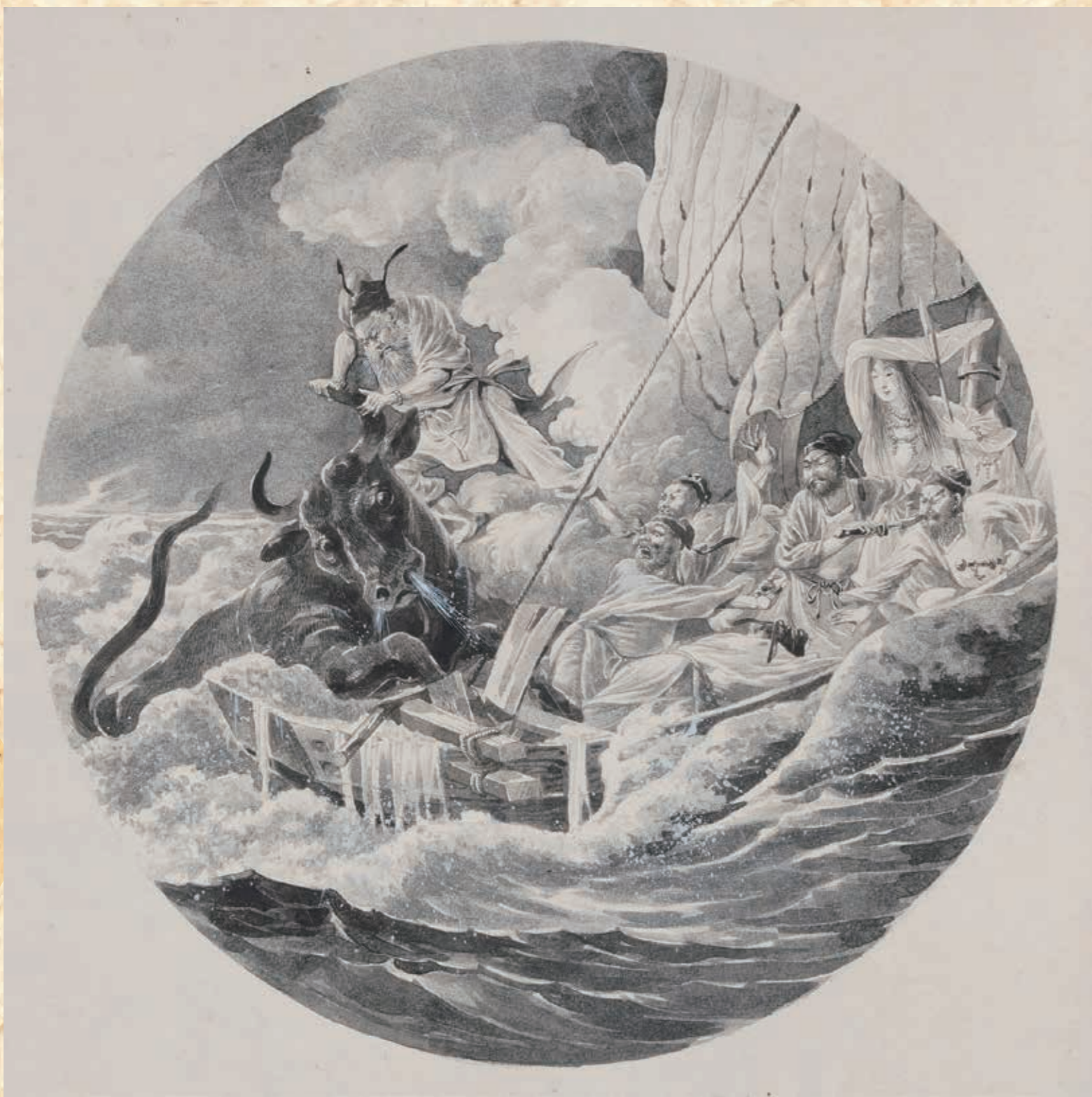
(『香椎宮幻灯原図』九州産業大学図書館蔵より)